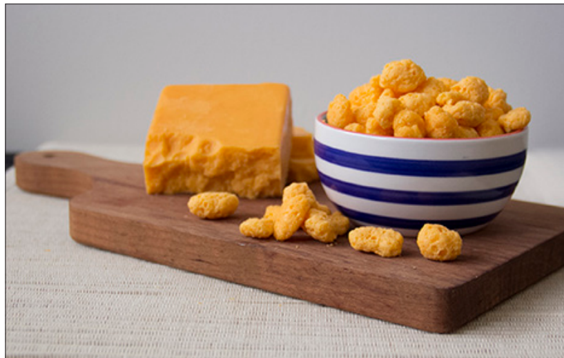
Crunchy Cheese Snacks

Die Erfolgsgeschichte der Firma zeigt, dass es ihr um mehr geht, als nur um Profit.