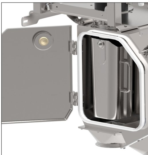
Separiereinheit mit geöffneter Reinigungsklappe

Der Metall-Separator RAPID 6000 kommt überwiegend in Industrien mit hohen hygienischen Ansprüchen zum Einsatz.